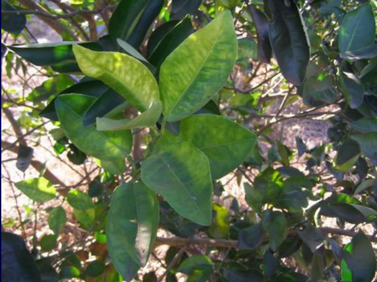
Brote con sintoma de mancha moteada