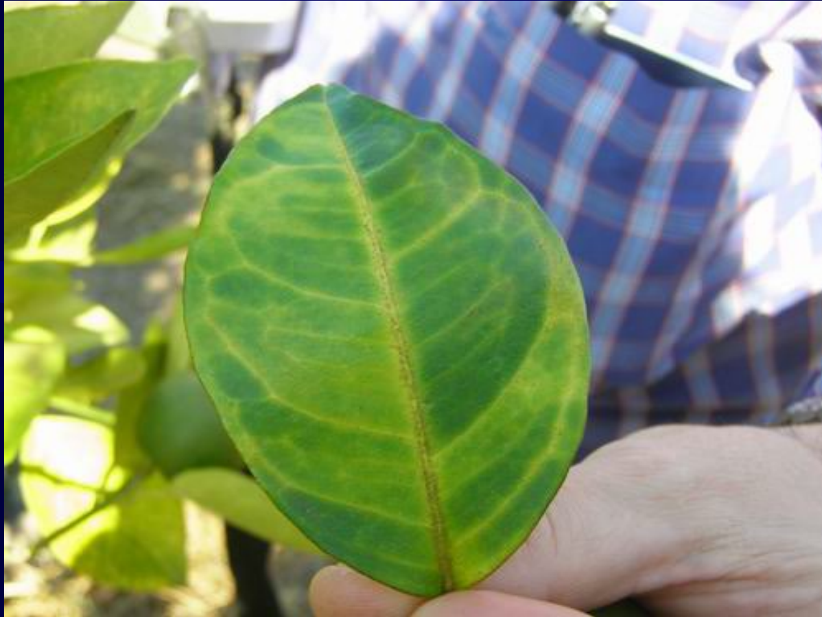
Síntoma característico de Huanglongbing