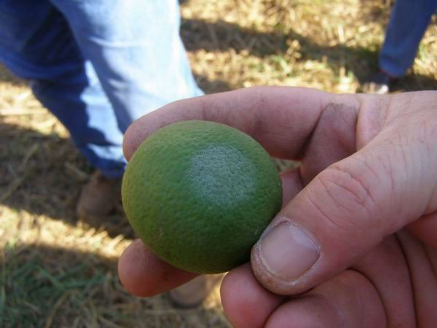
Coloración plateada al presionar sobre el fruto