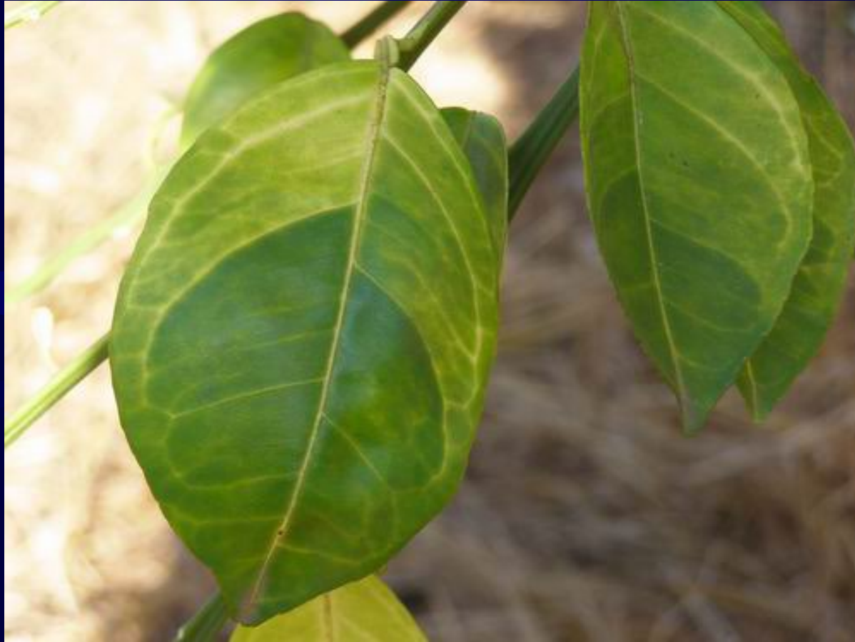
Síntoma característico de Huanglongbing