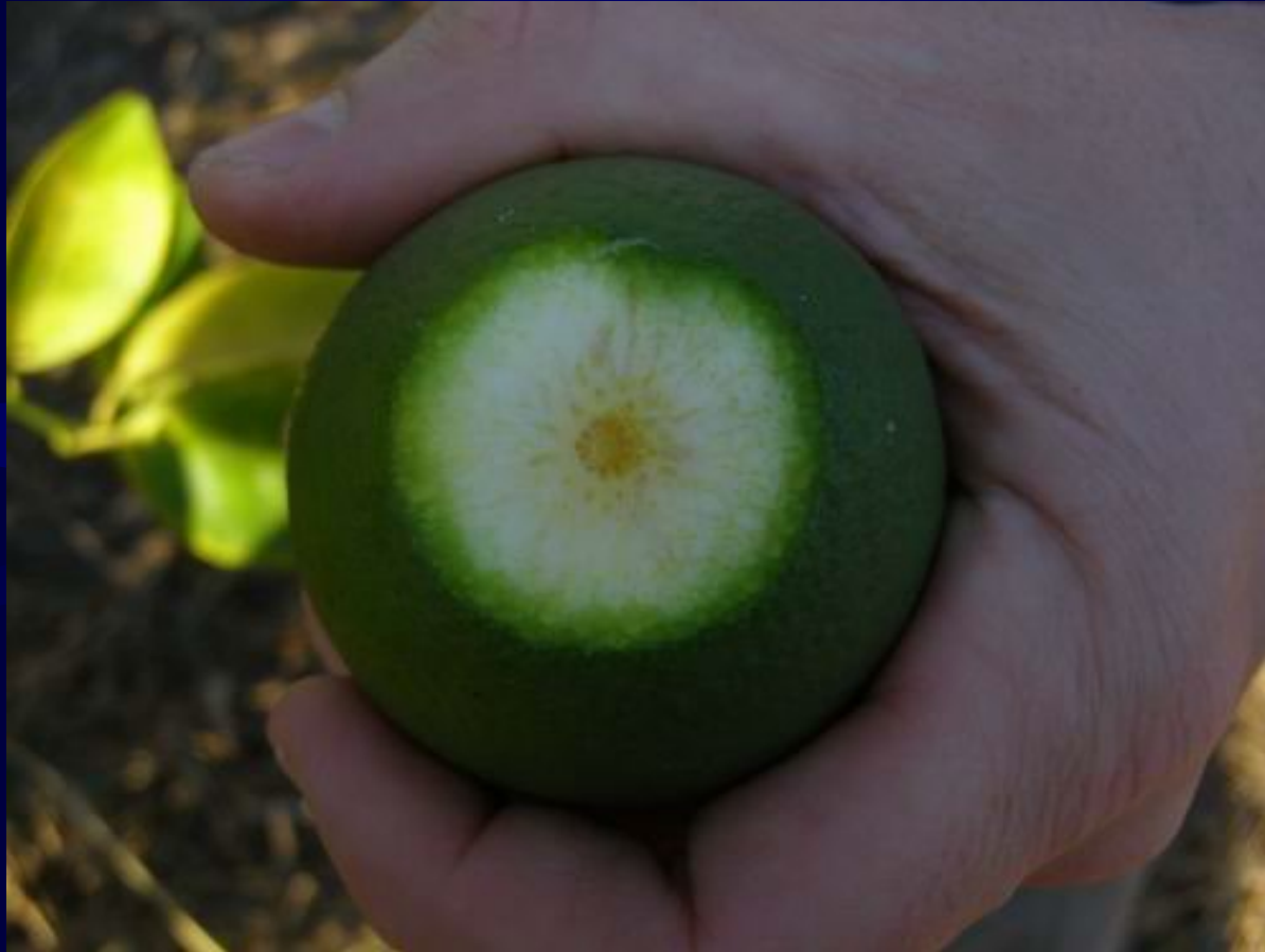
Corte en la zona peduncular