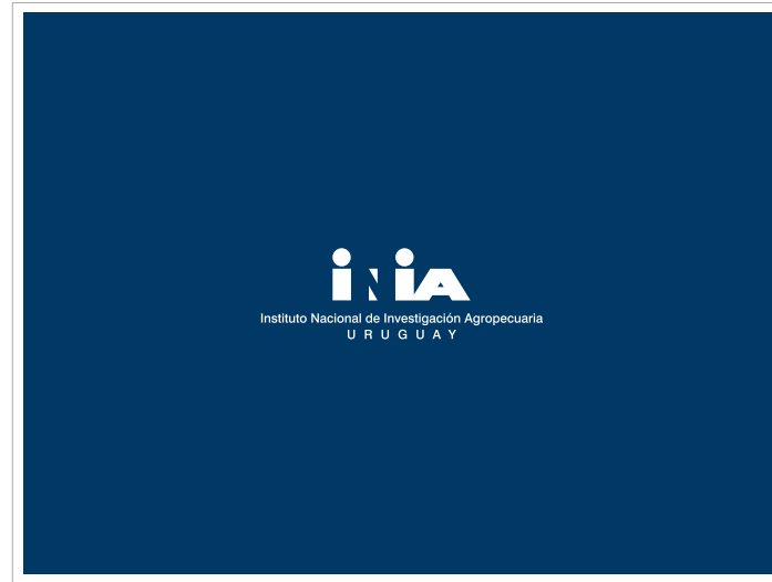
Primera diapositiva (siempre)