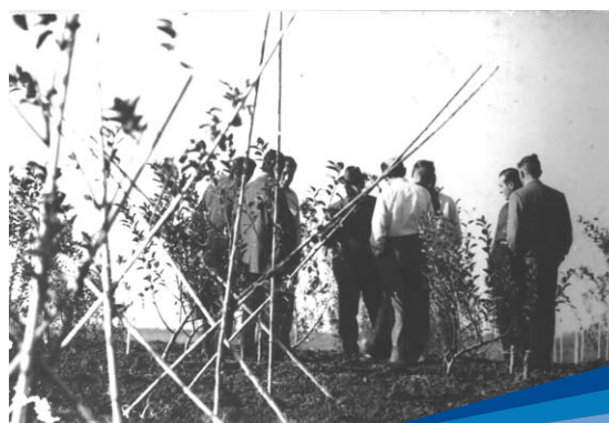
Instalación de primeros montes frutales