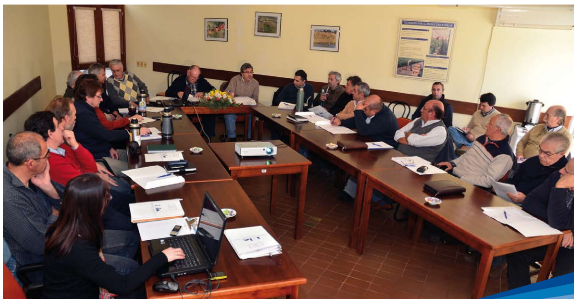
Consejo Asesor Regional

El CAR de Las Brujas está integrado en la actualidad por representantes de más de 20 organizaciones de productores y organismos públicos que actúan en su área de influencia.