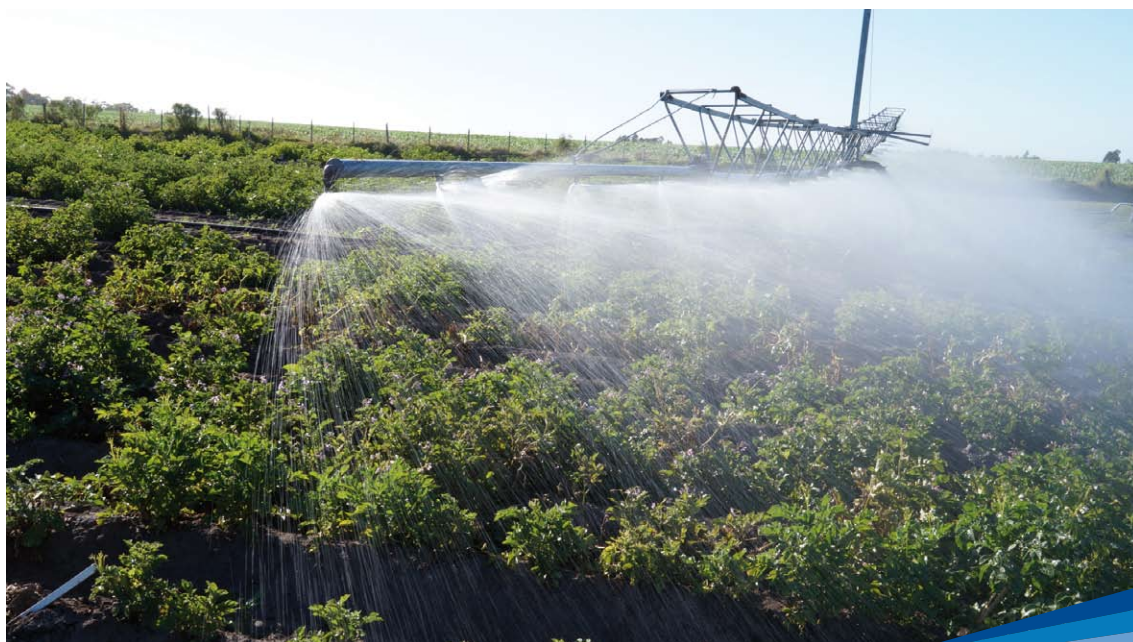
Riego en cultivos de papa