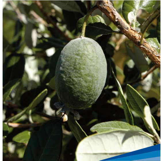
Guayabo del país

conocido una realidad a la que pudo aportar su experiencia y conocimientos.