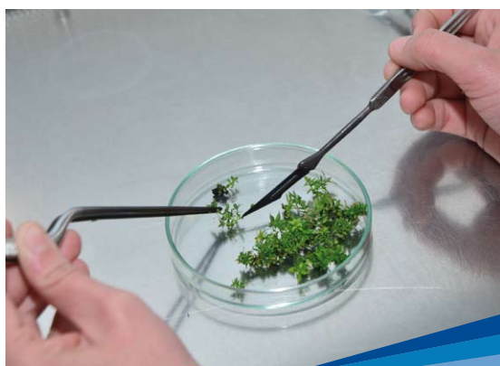
Multiplicación in vitro

Sin embargo, con el desarrollo de las herramientas genómicas se ha iniciado una nueva era en la genética molecular, y también en su contribución al mejoramiento genético en los programas que han adoptado la información genómica en combinación con los datos productivos y las genealogías, implementándose lo que hoy se conoce como selección genómica.