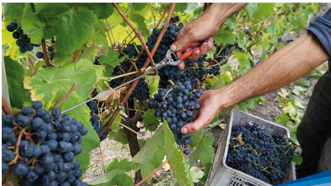
Época de la vendimia

Elaborar proyectos de investigación interinstitucionales e interdisciplinarios se convirtió en un factor de principal importancia. INIA financió la generación de tecnología con parte de sus fondos (Fondo de Promoción de Tecnología