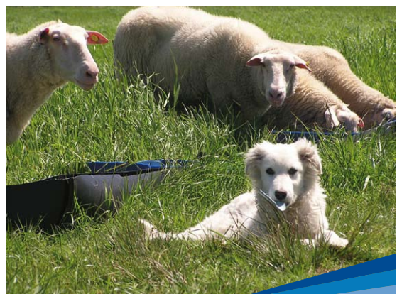
Perro Pastor Maremmano con ovejas

Hay tres industrias que procesan leche de cabra y, en el Parque de Actividades Agropecuarias (PAGRO), algunos productores envasan en sachets el producto. PAGRO funciona en un predio de 40 hectáreas perteneciente a la