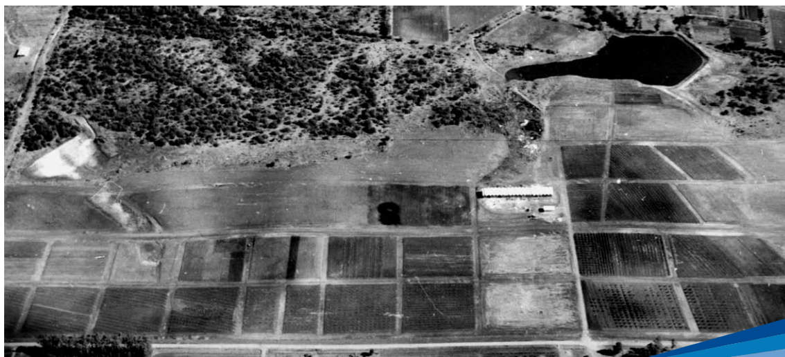
Vista aérea de las primeras parcelas, tajarar y edificio, 1968