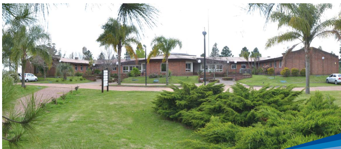
Edificio central de INIA Las Brujas