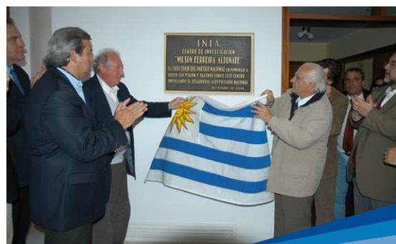
Nominación de la Estación Experimental como “Wilson Ferreira Aldunate”

INIA -persona pública no estatal que funciona bajo el régimen del Derecho Privado- se basa en un sistema de cofinanciación. La Ley de Creación del Ins-