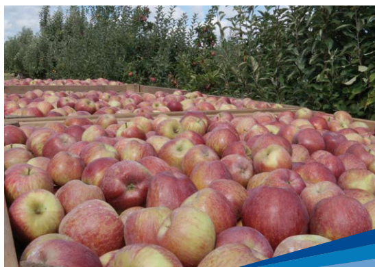
Cosecha de Manzanas