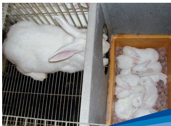
Instalación de producción de conejos en INIA Las Brujas

En el año 2000 se introdujeron embriones vitrificados de dos líneas sintéticas originadas en el