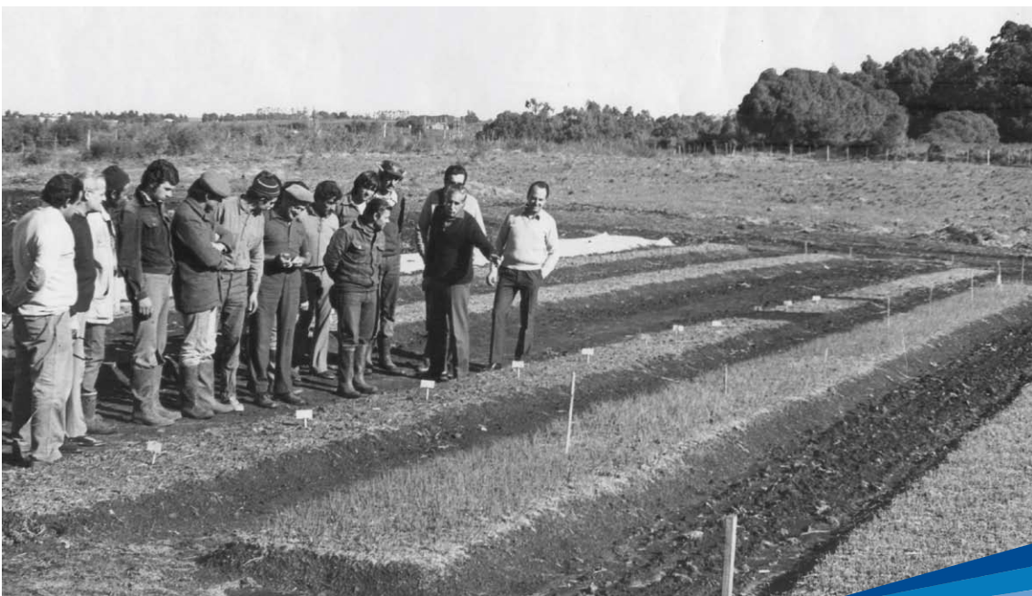
Visita a ensayos en almácigos de cebolla