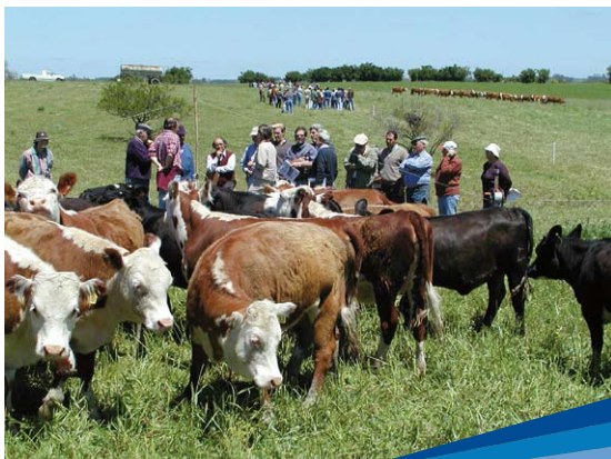
Día de campo sobre producción intensiva de carne vacuna