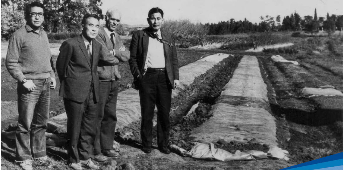
Convenio JICA en hortalizas

y Desarrollo del Riego) a todo este sistema de distribución y fuentes de agua para riego.