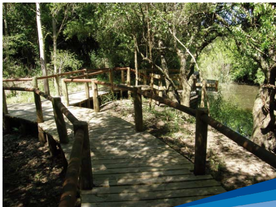
Parque Natural INIA Las Brujas