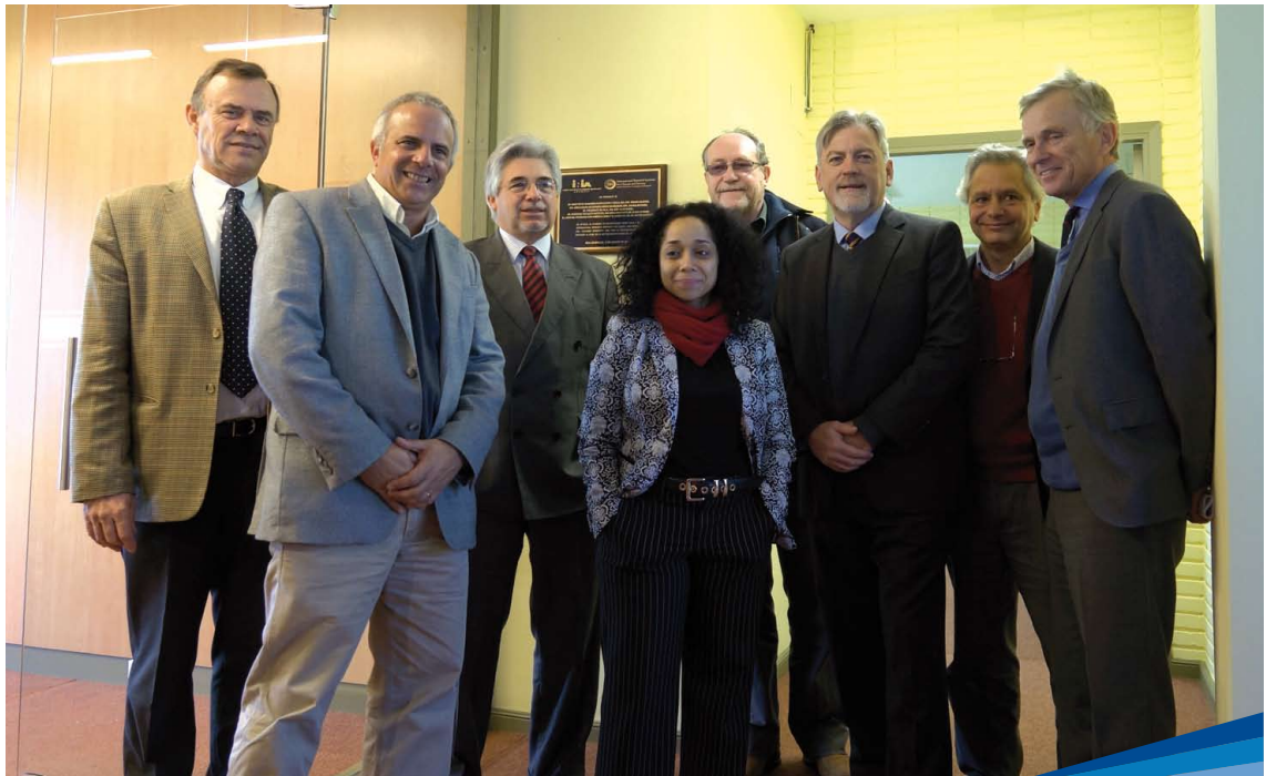
Inauguración de oficina de IRI

Las acciones prioritarias de la Unidad de Agroclima y Sistemas de información (GRAS) de INIA son promover, coordinar y ejecutar proyectos de investigación, estudios y otras actividades relativas al clima y el cambio climático, y su interacción con los sistemas de producción agropecuarios y forestales, y el desarrollo de Sistemas de Información y Soporte para la Toma de Decisiones para la gestión de riesgos asociados al clima en la producción agropecuaria.