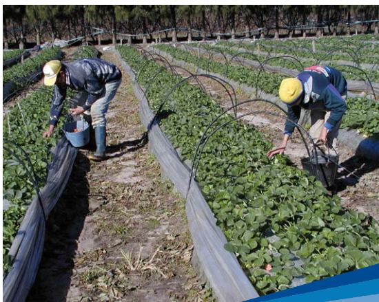
Recolección de frutilla en un predio familiar

Introducir producción animal intensiva en la labor de Las Brujas -proceso en el que partici-