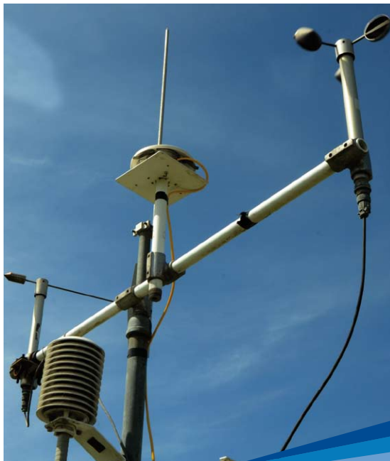
Estación meteorológica automática

La Unidad desarrolla la aplicación INIA para teléfonos inteligentes, denominada SIGRAS App, que brinda información de estado de la vegetación, agua en el suelo, clima histórico, suelos, entre otras variables, para el área en donde el usuario se encuentra posicionado.