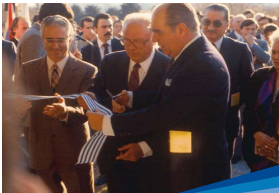
Inauguración Laboratorio de Biotecnología