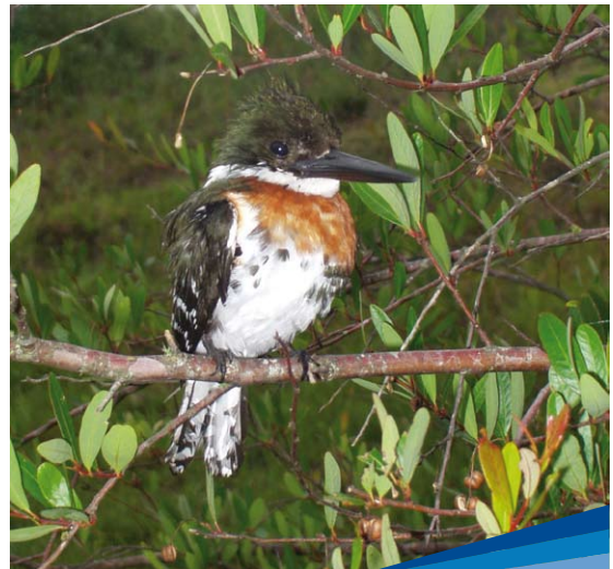
Martin Pescador ( Cloroceryle americana )

Hoy forma parte del Área Protegida Humedales del Santa Lucía. La gestión realizada para su restauración y la estrecha relación con diversas actividades productivas de la Regional convierten al Parque en una excelente plataforma demostrativa para la gestión de zonas de amortiguación y áreas riparias para el cuidado de los recursos hídricos en una cuenca de alto interés nacional.