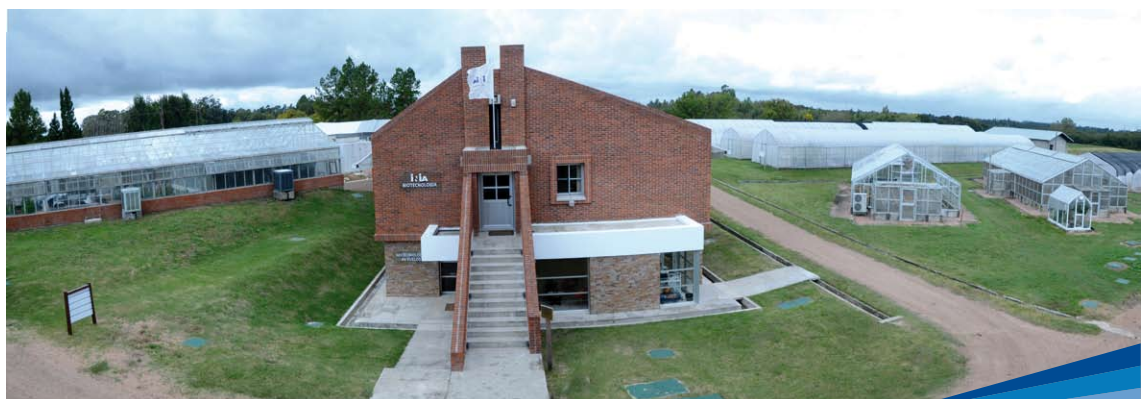
Vista panorámica de invernáculos y del edificio de Biotecnología, Genómica, Bioinsumos y Microbiología de Suelos