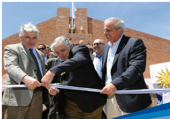
Inauguración de la Plataforma de Investigación e Innovación en Biotecnología aplicada a Genómica Animal y Desarrollo de Bioinsumos

Señala que en el período de la colaboración japonesa se gestó “el embrión” del actual Laboratorio de Biotecnología. El equipamiento y hasta los reactivos aportados por JICA en aquellos años continúan en grado óptimo de funcionamiento, por ejemplo. Ya creado INIA, los préstamos del BID permitieron dar “un nuevo impulso” al área de biología molecular, destaca.