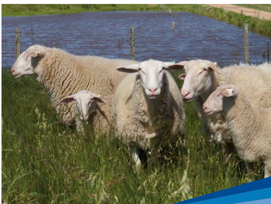
Producción ovina (raza Frisona Milchschaef)

En 2005 se concretó el primer remate, de una Frisona Milchschaef. Los remates ya llegaron a 11.