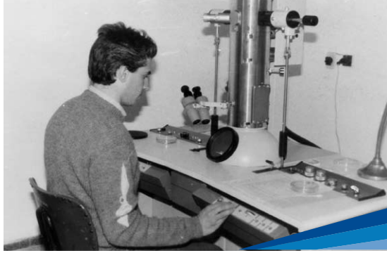
Primer microscopio electrónico donado por JICA