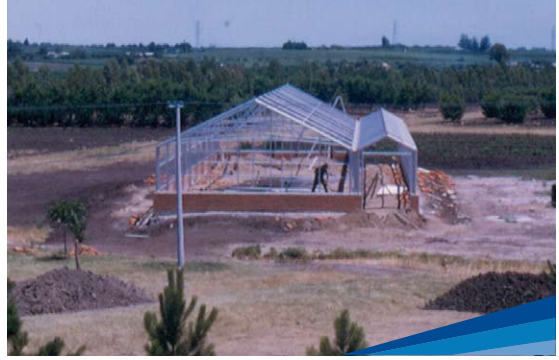
Construcción de invernáculo