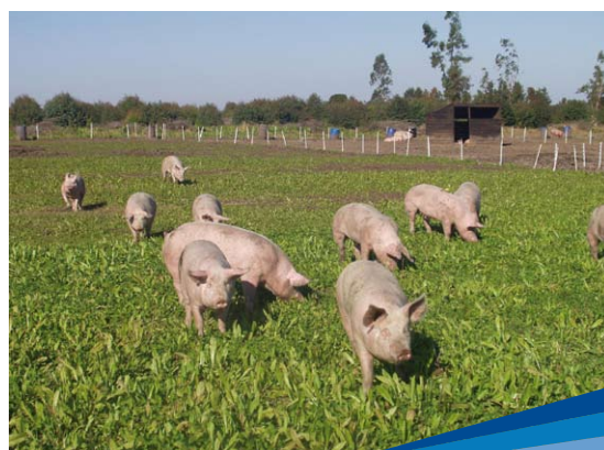
Cerdos en pradera

También fue un momento de cambio en el foco de las estrategias de investigación, porque se comenzaron a analizar los sistemas de producción en un ámbito geográfico determinado, puntualizó el Ing. Capra. Esto se consolidó después en un