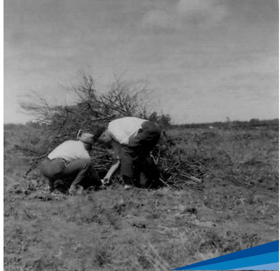
Limpieza del terreno cedido por el Consejo del Niño