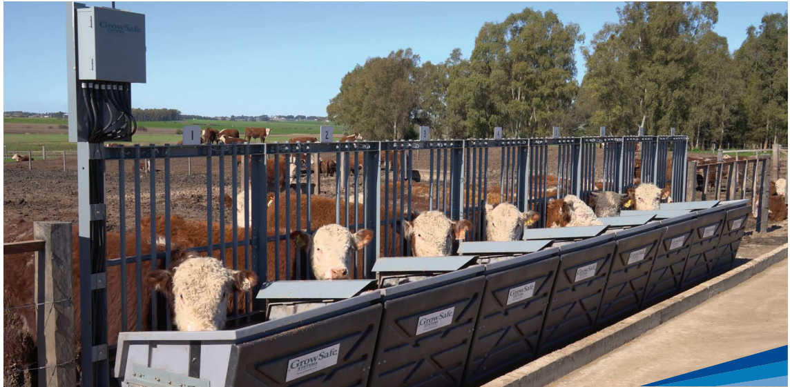
Animales Hereford en Central de Prueba Kiyú