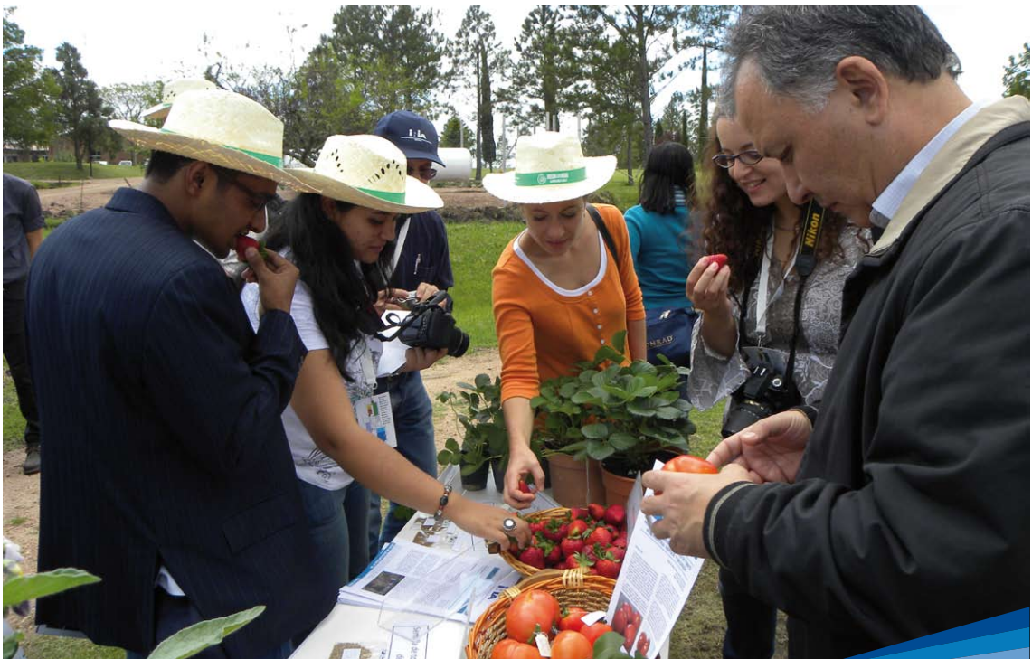
Visita de delegación de extranjeros