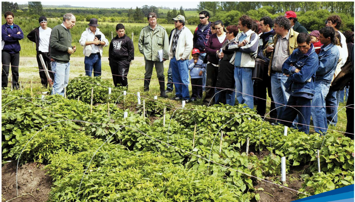
Día de campo con productores

En 2002, la coordinación nacional de la entonces denominada Unidad de Difusión (UCTT, desde 2006) se instaló en Las Brujas.