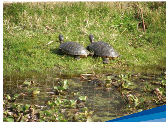
Fauna del Parque Natural