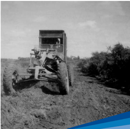
Limpieza del predio y nivelación del terreno