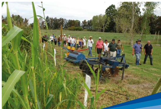
Abonos verdes y mínimo laboreo

Arboleya destaca que se está trabajando en un proyecto de mecanización del cultivo de cebolla, como consecuencia de los problemas de falta de mano de obra en general y, particularmente, de personal calificado. Es un proyecto de ejecución conjunta con la Estación Experimental de la Facultad de Agronomía Salto y el Centro Regional Sur de la Facultad de Agronomía (ambos