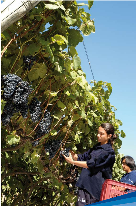
Ensayo en vid

El investigador de Las Brujas destaca que algunas de las principales contribuciones de INIA al proceso de modernización y mejora del sector son: