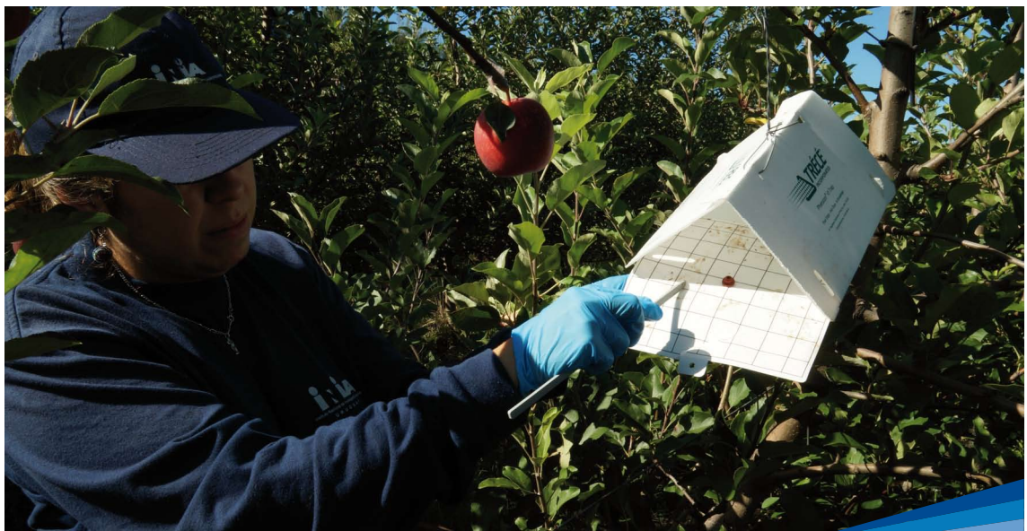
Técnica de Confusión Sexual - Programa Manejo Regional de Plagas