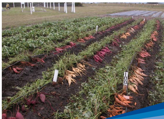
Boniatos: selección clonal

Anualmente se siembran 15.000 hectáreas, en diversos sistemas productivos, con destino principal al mercado interno (95%), “lo cual ha limitado, en parte, el crecimiento sectorial”, explica.