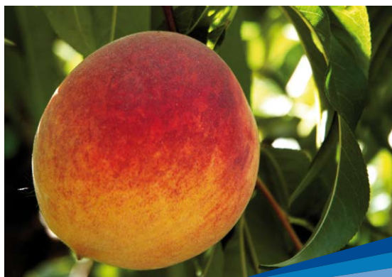
Durazno Moscato Delicia

Agrega que los productores “veían cómo se lograba aumentar la productividad y, además, la calidad de la fruta. La visita a los ensayos instalados en la Estación Experimental fue un argumento de gran peso para que el consejo y la recomendación de los investigadores empezase a ser tenida en cuenta”.