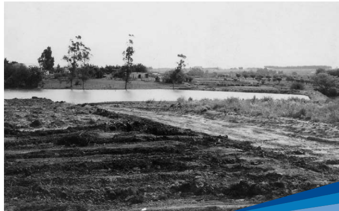
Represa para riego