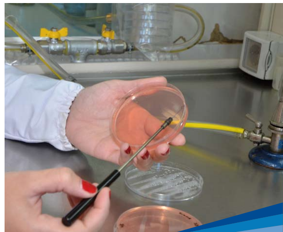
Aislamiento de bacterias en cámara de flujo

* La generación de conocimiento para una óptima expresión agronómica de la fijación biológica de nitrógeno en soja y leguminosas forrajeras.