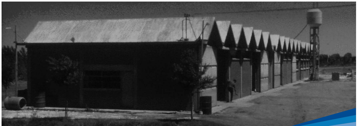
Primera edificación de galpones y oficinas