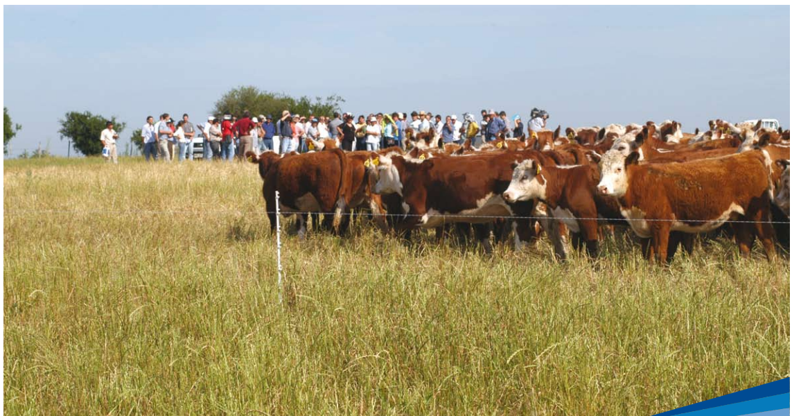
Producción vacuna intensiva en el módulo de Las Brujas

De esa forma, fue posible el desarrollo de modelos para diferentes alternativas de engorde va-