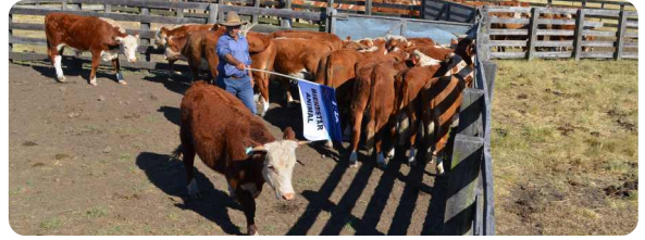
Figura 1: Bloqueo del ángulo de visión monocular izquierdo, para orientar al animal hacia la derecha del corral.