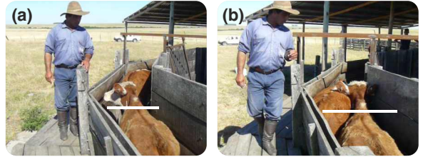
Figura 2: a) Operario situado delante del punto de balance y b) yendo hacia atrás del punto de balance para que el animal avance.