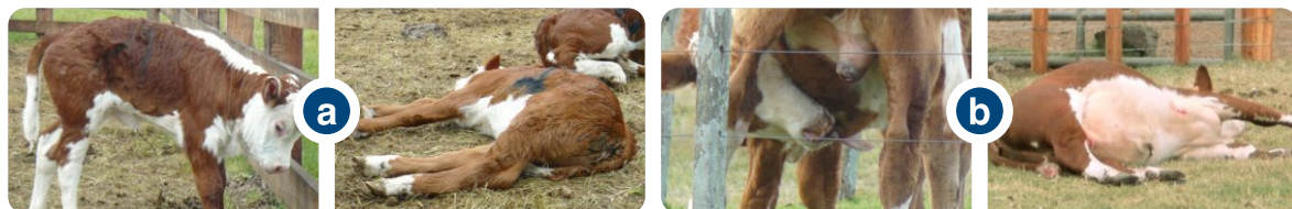
Figura 1. Castración con Cuchillo tradicional. Comportamientos de dolor (parado encorvado, echado lateral, gira la cabeza más allá de la paleta): a) terneros de 1 semana de edad. b) terneros de 6-7 meses de edad.