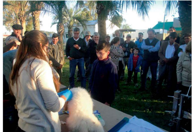
Entrega de cachorros en San Carlos Maldonado