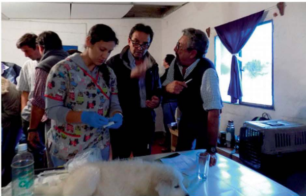
Entrega de cachorros en Porvenir Paysandú