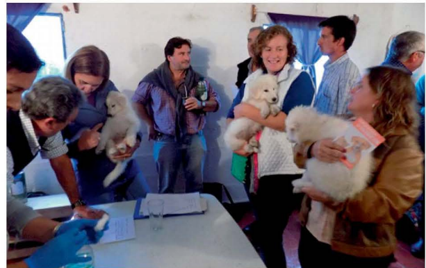
Entrega de cachorros en Porvenir Paysandú