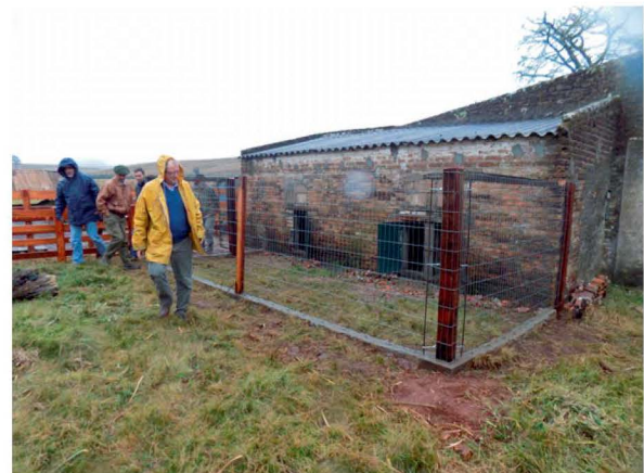
Canil de Néstor Silvera