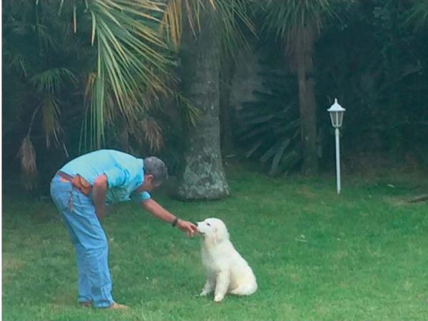
Cachorro importado con el nombre Temer

A continuación se muestran algunas fotos del cachorro macho Temer cuando se trajo al país.