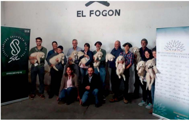
Entrega de cachorros en Cooperativa el Fogón de Sarandí del Yi.