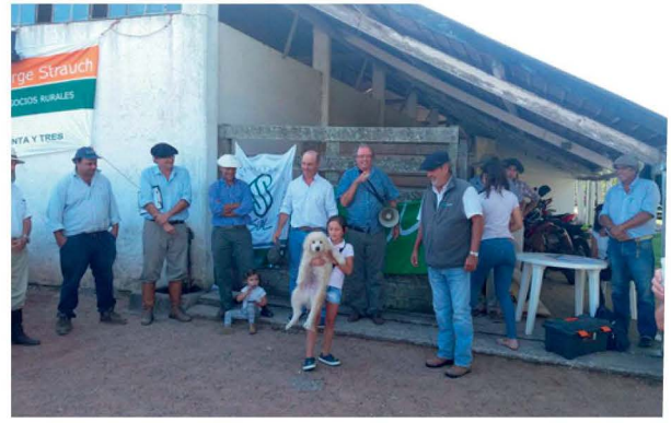
Entrega de cachorros en Sociedad Fomento de Treita y Tres