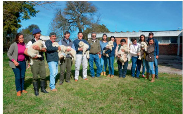
Entrega de cachorros en Paysandú criadero de familia Brassesco