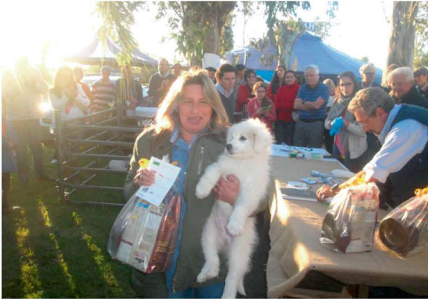
Entrega de cachorros en San Carlos Maldonado