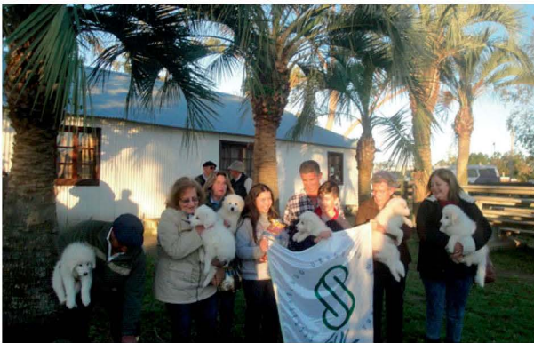
Entrega de cachorros en San Carlos Maldonado