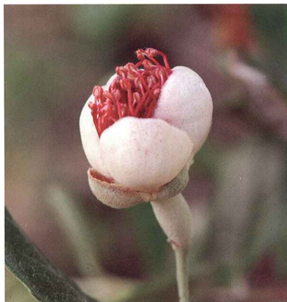
Estado C. Se ven los estambres (pétalos totalmente visibles).