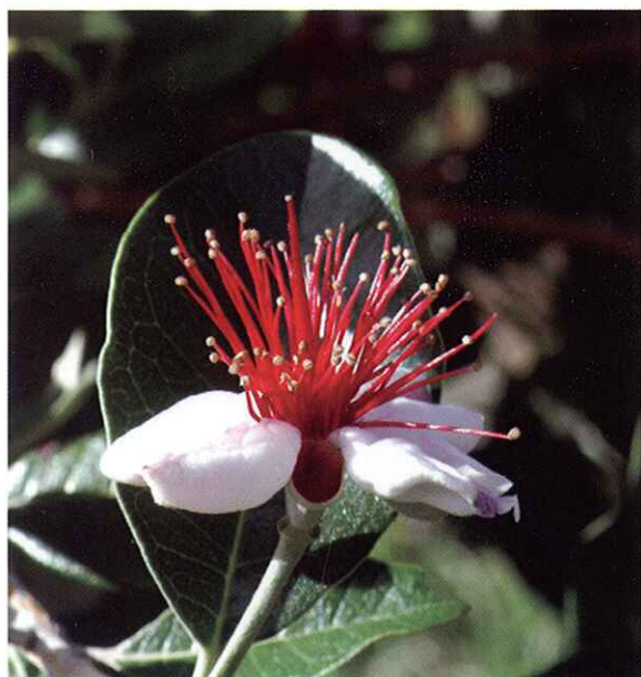
Estado E. Flor abierta.