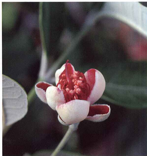
Estado D. Pétalos y estilo desplegados.