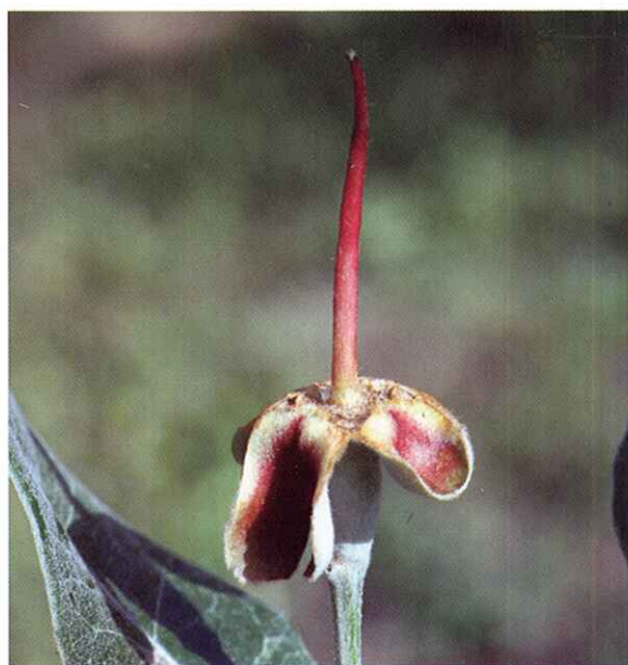
Estado H. Fruto cuajado (caída de anteras).