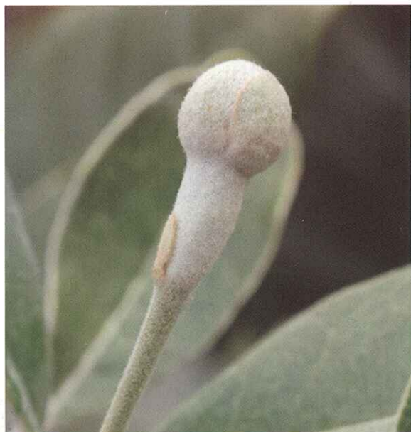
Estado A. Botón floral.

Según G. Thorp y R. Bielecki (Instituto de Investigación en Horticultura y Alimentos de Nueva Zelanda, Ltda., 2002)