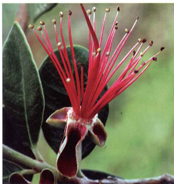
Estado G. Caída de pétalos.