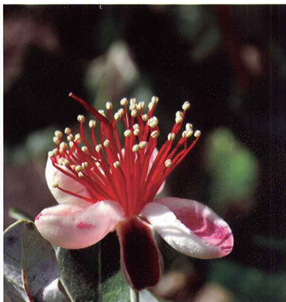
Estado F. Flor abierta con anteras maduras.