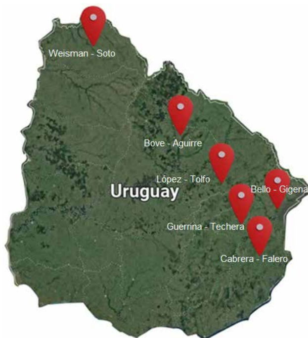
Figura 1 - Croquis de sistemas de referencia.

Monitoreo: monitoreo de seis sistemas de referencia (SDR) distribuidos en todas las zonas arroceras del Uruguay. Estos SDR, son representativos de la forma de gestión en los que hay un ganadero propietario de la tierra y un arrocero arrendatario de tierra y/o agua. Seguido de una instancia de consulta sobre los aspectos y parámetros que condicionan el desempeño de los sistemas, a una muestra de ganaderos y arroceros usuarios de estos sistemas.