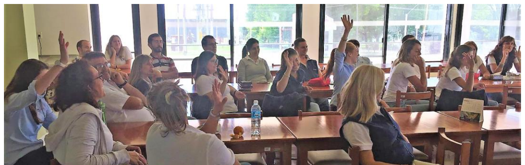
Funcionarios de INIA La Estanzuela durante las actividades por el Día de la Mujer.

Las medidas a implementarse consolidarán las ya tomadas por el instituto, que actualmente asegura la misma remuneración a igual cargo sin discriminar por género, cuenta con salas para amamantar en todas sus estaciones experimentales y cumple con el horario especial por maternidad dispuesto por ley.