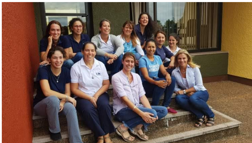
Funcionarias de INIA Salto Grande durante las actividades por el Día de la Mujer.

Montevideo, 9 de marzo de 2019 - El pasado 8 de marzo, en el marco del Día de la Mujer, el Instituto Nacional de Investigación Agropecuaria (INIA) llevó adelante múltiples actividades internas y anunció otras a concretarse en el corto y mediano plazo, las cuales forman parte de un mapa de ruta definido por la entidad con el objetivo de seguir mejorando sus políticas de género.