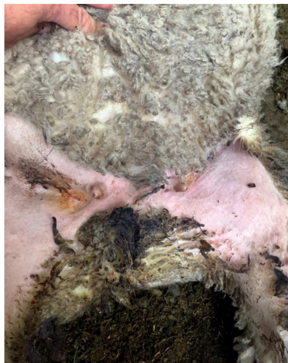
Figura 3: Inspección de ovejas a la señalada. Ovejas gestantes a la ecografía pero no paridas: sin evidencia de parto ni ubre desarrollada.

Como se observa, la mayor cantidad de pérdidas se dio en ovejas que parieron pero que no estaban criando corderos, es decir, que se correspondían con pérdidas posparto. La proporción de ovejas gestantes a la ecografía que no parieron (abortos) fue relativamente baja, por lo que se desestimó que la ocurrencia de abortos fuera un importante determinante de la baja tasa de señalada en el marco de la consulta previa del productor. Esta información sumada a los datos del desarrollo de las borregas al primer servicio, al bajo tamaño de los corderos al parto en general y a la presencia de depredadores, permitió tomar una decisión informada que ayudó a concentrar las medidas de control en el período