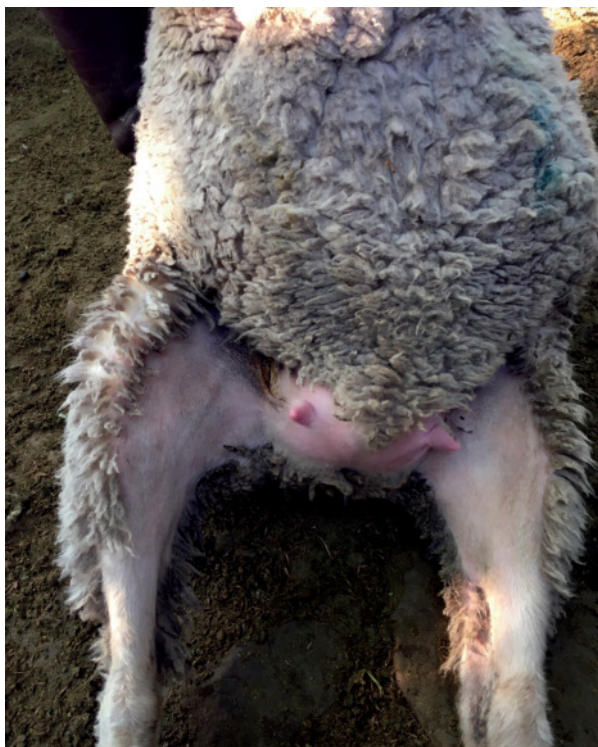
Figura 1: Inspección de ovejas a la señalada. Ovejas paridas criando cordero: manchas del parto en la lana, ubre desarrollada y pezones limpios por el mamado de los corderos.