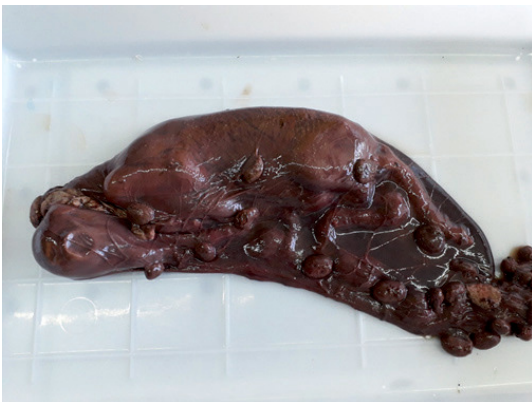
Figura 6: Feto ovino abortado envuelto en la placenta remitido al laboratorio de diagnóstico. El feto se encontraba momificado. El aborto se debió a toxoplasmosis -enfermedad abortiva más frecuentemente diagnosticada en nuestro estudio-.

Figura 5: Envío correcto de muestras al laboratorio. Antes de remitir muestras debe contactarse al laboratorio para acordar las condiciones de envío. Idealmente debe colectarse el feto y la placenta, colocarlos en doble bolsa impermeables e intactas para evitar pérdida de líquidos y, de ser posible, enviar una muestra de suero de la oveja abortada. Las muestras deben manipularse usando equipo de protección personal (guantes de látex, botas de goma, mameluco), ser correctamente identificadas (i.e., con la fecha del aborto y número de caravana de la madre) y ser enviadas en cajas de espuma-plast con refrigerantes (geles o botellas plásticas bien cerradas conteniendo agua congelada), debidamente embaladas. Además, las mismas deben remitirse al laboratorio tan pronto como sea posible y contactar nuevamente al laboratorio para informarse del método de envío, número de rastreo, predio de origen (propietario, número de DICOSE) y otra información clínico- epidemiológica que el laboratorio solicite. Diagrama cortesía de Matías Dorsch (INIA La Estanzuela).