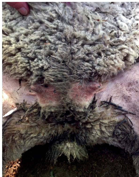
Figura 2: Inspección de ovejas a la señalada. Ovejas paridas sin criar cordero: manchas del parto en la lana de la zona perineal, ubre desarrollada pero con pezones sucios por falta del mamado de los corderos.

❖ Ovejas paridas criando cordero (71,6%): manchas del parto en la lana de la zona perineal y/o miembros posteriores, ubre desarrollada y pezones limpios por el mamado de los corderos (Figura 1).