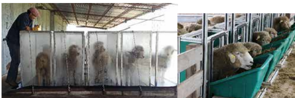
Mediciones individuales de metano y consumo individual en INIA La Magnolia