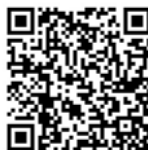
INIA Informa n° 1 (Enero-Marzo 2019)

Para descargar las ediciones anteriores de INIA Informa apunte con su cámara a los siguientes códigos QR: