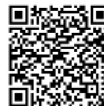
INIA Informa n° 2 (Abril-Mayo 2019)