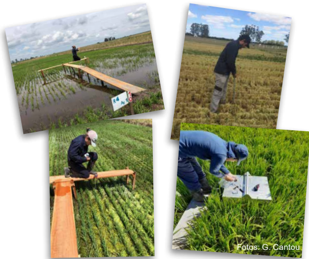
Figura 1 - Determinación y muestreo de suelo, agua y emisión de gases.

INIA ha incorporado crecientemente estos temas a su agenda de investigación en las últimas décadas, destacándose algunos hitos: