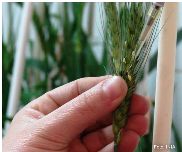
Figura 4 - Inoculación de espigas de materiales de trigo en condiciones controladas para caracterización del tipo II de resistencia (resistencia a la dispersión del Fusarium en la espiga).