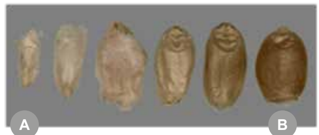
Figura 1 - Efecto de Fusarium spp. según el momento fenológico del trigo (A) a inicio de llenado de grano, (B) sobre un grano ya formado. En todos los casos es posible tener contaminación con deoxinivalenol (DON).

El hongo puede invadir, colonizar y producir micotoxinas desde la etapa de floración (período crítico más susceptible) y durante el llenado de grano (infección tardía predominantemente invasión de tipo saprofito), en tanto ocurran condiciones de humedad y temperaturas favorables. Las condiciones óptimas para la infección son lluvias frecuentes y alta humedad relativa que aseguren mojado de espigas por al menos 2-3 días y temperaturas entre 24-26 °C. Si la infección ocurre en la floración, el grano no se desarrolla mientras que, si sucede durante el llenado de grano, estos pueden tener un tamaño menor (chuzos) hasta normal (Figura 1), pero con contaminación con Fusarium y por tanto, con DON. Consecuentemente, cuanto más temprana sea la infección, mayor será el efecto de la FE en el rendimiento, la calidad física e industrial del grano y en la concentración de DON.