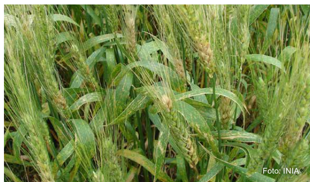
Figura 5 - Síntomas típicos de fusariosis de la espiga en cultivo de trigo.

Umpierrez-Falaiche, M. et al. 2013. Regional differences in species composition and toxigenic potential among Fusarium head blight isolates from Uruguay indicate a risk of nivalenol contamination in new wheat production areas. International Journal of Food Microbiology 166:135-140.