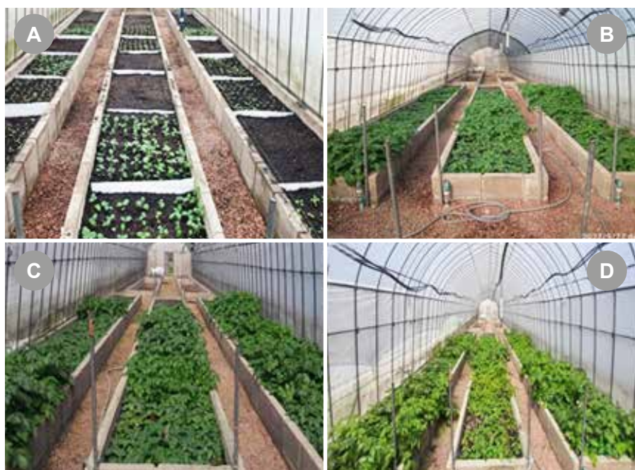
Figura 2 - Imágenes del ensayo donde se ve la evolución de las plantas de los distintos tratamientos. A) 7 días desde implantación, B) 47 días desde implantación, C) 62 días desde la implantación, D) 91 días desde implantación.