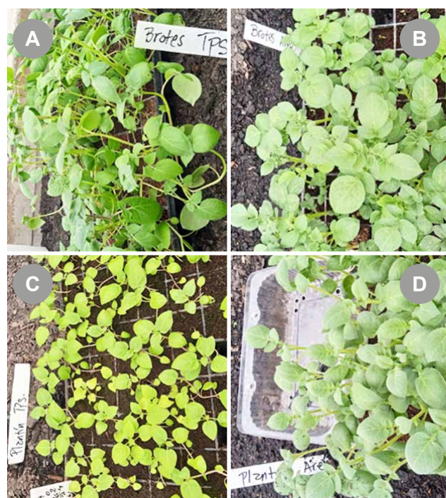
Figura 1 - Imágenes de los plantines origen TPS y del cultivar 'INIA Arequita' utilizados en el ensayo. A) brotes TPS, B) brotes de 'INIA Arequita', C) plantín TPS a partir de semilla, D) plantín de 'INIA Arequita' a partir de esquejes.

Los mismos tratamientos –a excepción de brotes TPS– se instalaron en un ensayo a campo el 7 de marzo y se cosecharon el 9 de junio 2023. El ensayo se realizó en canteros a 1,6 m de distancia y 0,25 m entre plantas (2,5 pl/m 2 ). Se incluyó además un segundo tamaño de minitubérculos (20 g). Se clasificó el rendimiento de acuerdo a las categorías: menor a 20 g, entre 20 y 40 g, entre 40 y 80 g, 80 a 200 g y mayor a 200 g.