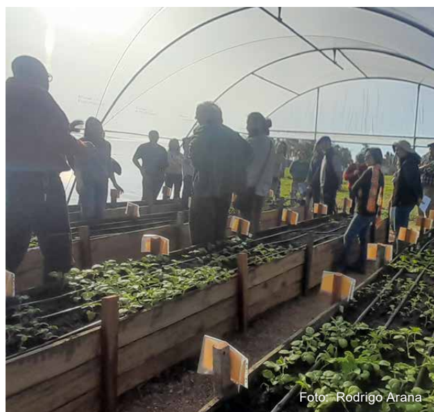
Figura 4 - Jornada de presentación de resultados y recorrida de ensayo, Centro Regional Sur (CRS), Fagro.

Medias con una letra común no son significativamente diferentes (p > 0.05)