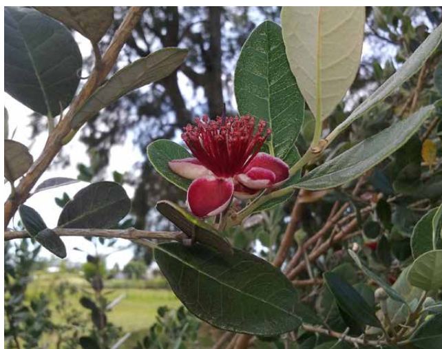
Figura 3 - Flores de CLA F1P3 – 'INIA Fagro Armonía'.