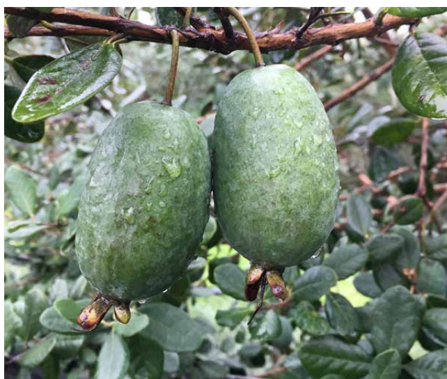
Figura 4 - Frutos de CLA F1P3 – 'INIA Fagro Armonía'.

Con 'INIA Fagro Armonía' se pone a disposición un nuevo cultivar comercial de guayabo del país, que se destaca por su buena productividad, tamaño y calidad de frutos.