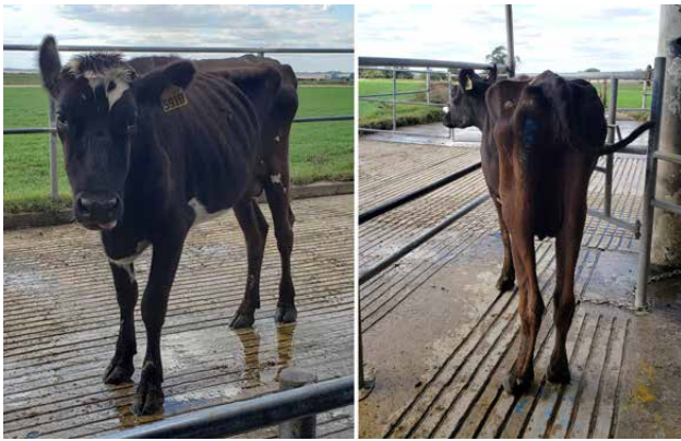
Figura 1 - Vaca con pobre condición corporal (pérdida de peso) causada por paratuberculosis.

Esta enfermedad se caracteriza por un largo período de incubación (tiempo transcurrido desde la infección hasta la aparición de los primeros signos clínicos), que puede variar de dos a siete años. Los terneros presentan mayor susceptibilidad a la infección por MAP, aunque dado el largo período de incubación los signos clínicos se presentan en la edad adulta. Muchas veces los animales infectados son descartados por otros motivos antes de manifestar signos clínicos de paratuberculosis.