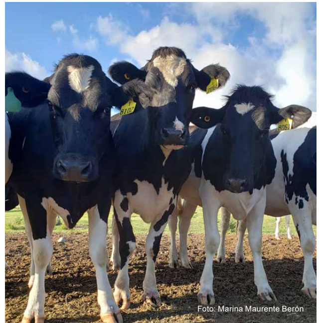
Figura 4 - Vaquillonas en el tambo de INIA La Estanzuela.

Se observó que la eliminación de la bacteria en heces fue más constante, en comparación con las muestras de leche, que presentaron positividad intermitente. El porcentaje de detección en heces y leche fue de 82,7 % y 32 %, respectivamente.