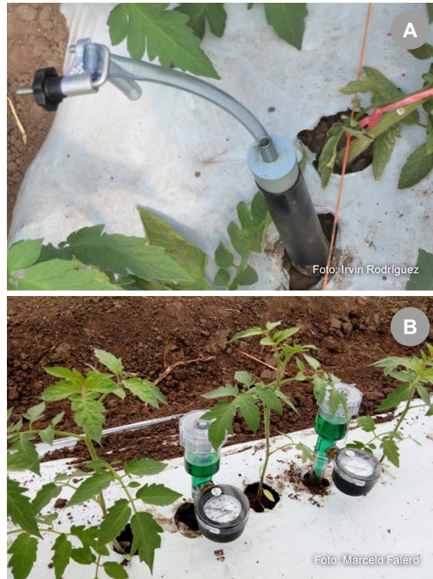
Figura 4 - Sondas de succión para el monitoreo de salinidad y nivel de Na + en la solución de suelo y tensiómetros para el manejo del riego.

En general, se han observado valores altos de salinidad y Na + en la capa superficial del suelo (0 - 20 cm) al trasplante de los cultivos de otoño (febrero-marzo), por las condiciones de alta evapotranspiración del verano y el ascenso de iones (Berrueta et al. , 2019). Los volúmenes aplicados en riegos individuales de lavado de sales se encuentran entre 20 y 40 mm (Thompson et al. , 2007). En caso de haber suelas de arada o zonas compactadas en el perfil de suelo se recomienda realizar laboreo vertical para favorecer el drenaje profundo.