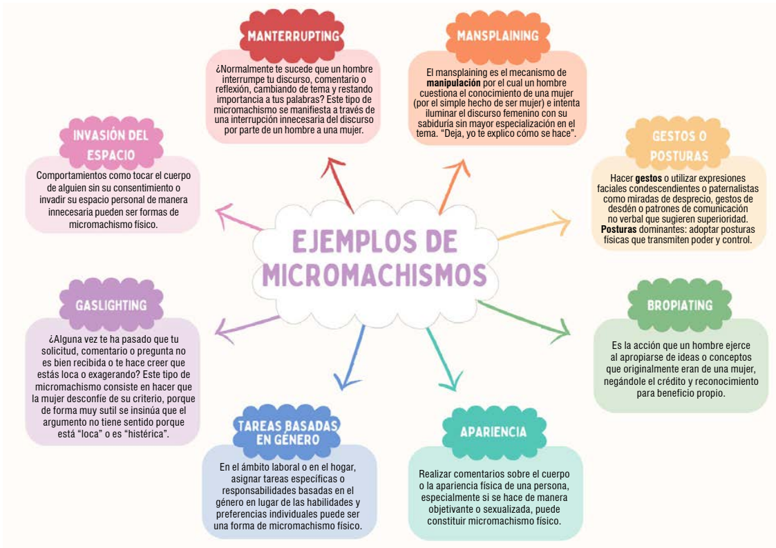
Figura 1 - Ejemplos de micromachismos.

El primer paso para poder tomar conciencia es identificar las acciones o actitudes micromachistas. Pero no es tarea fácil principalmente porque existe una presión social para conformarse a las expectativas de género tradicionales, y aquellos que desafían estas normas pueden enfrentar resistencia o críticas. En sociedades donde no se proporciona una educación adecuada sobre igualdad de género, puede ser difícil para las personas reconocer y comprender los micromachismos y sus implicaciones.