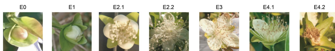
Figura 2. Estados florales en plantas de Eugenia involucrata (IX3, XIV2, XVI3 y XVI4) cultivadas en la Estación Experimental de Facultad de Agronomía en Salto