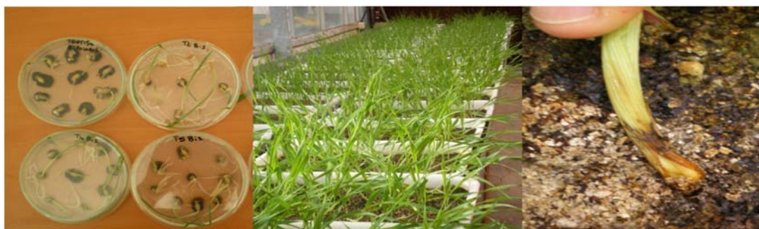
Figura 1. Evaluación de Bipolaris sorokiniana en cebada en condiciones de laboratorio e invernáculo.

En Uruguay existe un número reducido de laboratorios que realizan este análisis. La lucha contra las enfermedades antes mencionadas requiere de un diagnóstico preciso, por ej. si un lote de trigo presenta una incidencia de 0.25% de D. tritici-repentis implica que debo detectar 1 semilla en 400 semillas analizadas* asumiendo una trasmisión a plántulas de 31% implicaría la introducción de 1937 focos primarios. Por tal motivo uno de los objetivos que perseguimos los laboratorios que realizamos el análisis es establecer y padronizar los métodos y los procedimientos del análisis. La Asociación Internacional de Análisis de Semillas (ISTA) fundada en el año 1924 tiene como principales objetivos desarrollar, establecer y publicar procedimientos padrones para el muestreo y análisis de semillas así como promover la aplicación uniforme de estos procedimientos para la evaluación de semillas. Las Reglas para Análisis de Semillas del ISTA, publicadas y actualizadas desde 1928, son adoptadas actualmente en 73 países. El Comité de Sanidad de semillas de ISTA desarrolla y publica procedimientos validados para pruebas de enfermedades en semillas y promueve la aplicación uniforme de estos procedimientos para la evaluación de las semillas que se mueven en el comercio internacional. La utilización de esas reglas posibilita la padronización de procedimientos entre analistas, verificar los límites de tolerancia para la variación de los resultados e identificar problemas en la emisión de resultados.