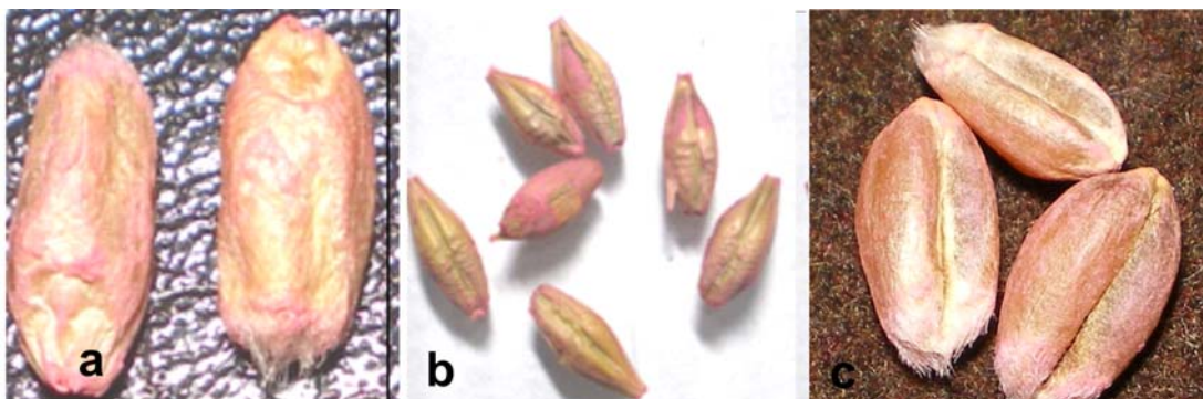
Figura 2. Cobertura deficiente de la semilla de trigo y cebada con el curasemilla.

Posteriormente se evaluaron un total de 300 semillas por tratamiento sobre medios de cultivos específicos para diagnóstico de hongos (Reis, 1983). Las determinaciones se realizaron en bloques espaciados en el tiempo donde dos veces por semana se plaquearon cinco placas de nueve semillas por tratamiento. Las mismas fueron colocadas en incubadora a 22 °C con alternancia