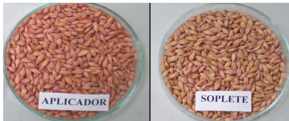
Figura 3. Calidad de curado de la semilla de cebada con dos métodos de aplicación, aplicador o pincel y pipeta con soplete.

de luz oscuridad de 12/12 h. durante siete días. Al final del período de incubación se cuantificó la presencia de hongos contaminantes.