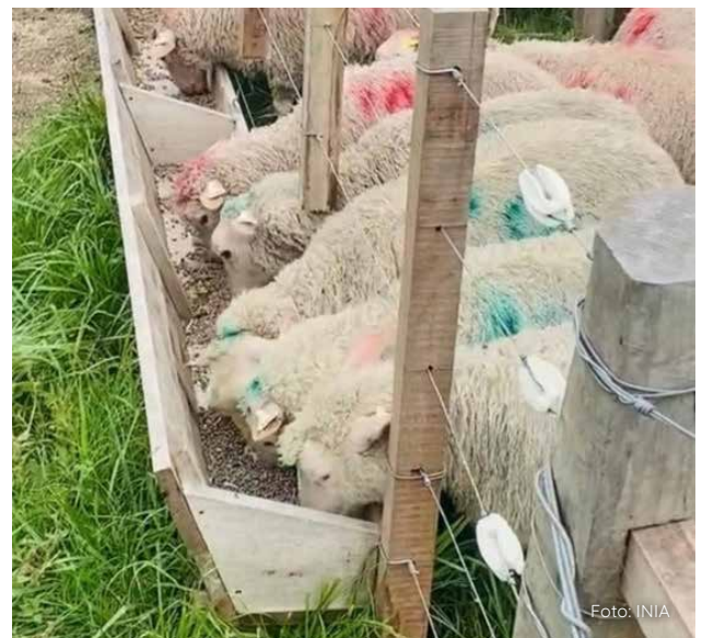
Figura 2 - Ovinos comiendo lupino.