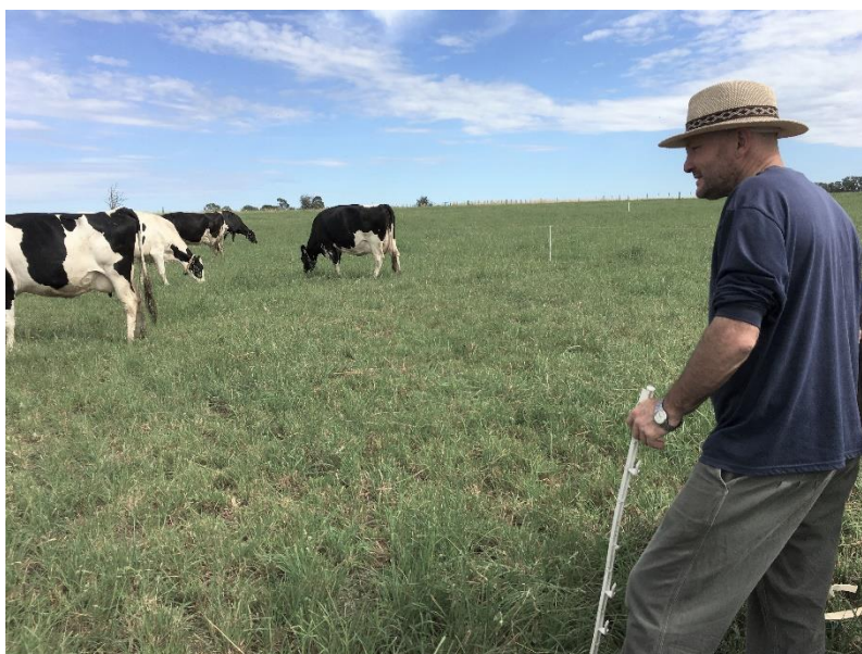
Mantener monitoreo de pasturas y rodeo.

Desde el punto de vista empresarial, puede ser una ayuda muy importante trabajar con técnicos asesores. La perspectiva “fresca” de alguien que conoce el sistema de producción y a usted como gerente/a del mismo puede aportar a encontrar soluciones nuevas. Tampoco es bueno “encerrarme en mi propio caso”, y no debe dejarse de intercambiar experiencias con otros productores que seguramente estén en condiciones parecidas. Es ahora cuando su aporte es más necesario.