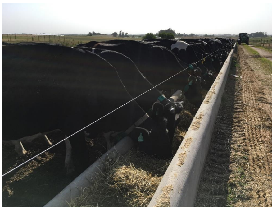
Pista de alimentación.